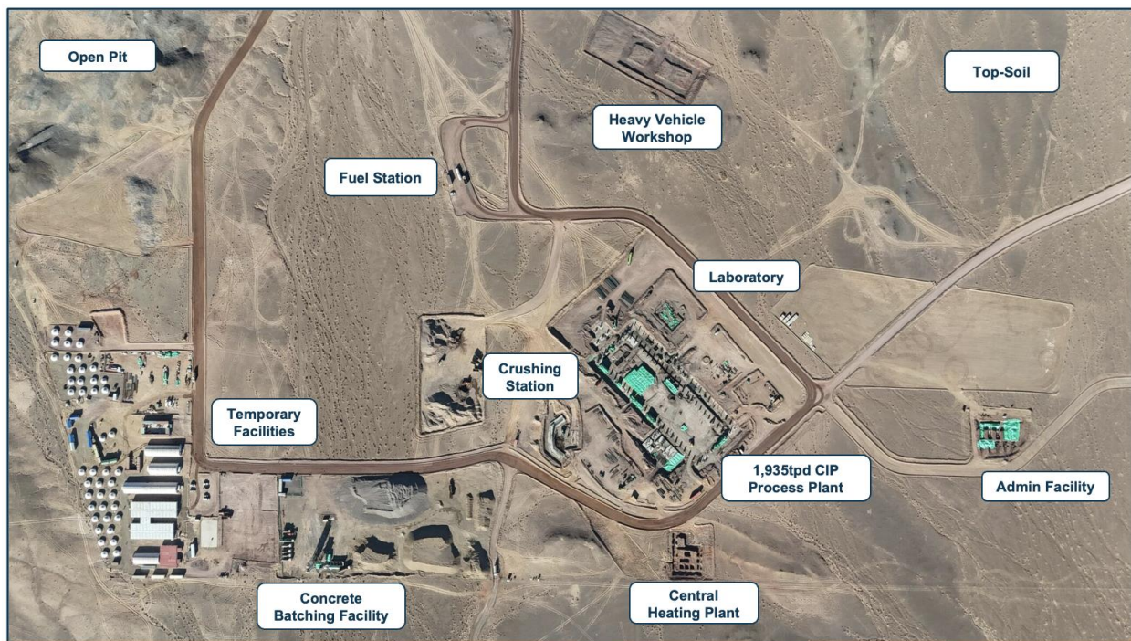
Боловсруулах үйлдвэр болон түр байгууламжуудын зураг – 2023 оны 10-р сар

Бүтээн байгуулалтын албан ёсны шийдвэрийг 2023 оны хоёрдугаар хагаст төслийн бэлтгэл ажил дууссаны дараа гаргав. Бүтээн байгуулалт 12% гүйцэтгэлтэй явж байгаа ба энэ хугацаанд боловсруулах үйлдвэрийн бутлуур, бетон зуурмагийн үйлдвэр, түлшний агуулах, түр кемп, барилгын зам, талбайн тэгшилгээ, нарийвчилсан газар шорооны ажлууд, томоохон төмөр бетон суурь, баганын суурилуулалт зэрэг байгууламжуудыг барьсан. Бүтээн байгуулалтын зургуудтай танилцана уу: