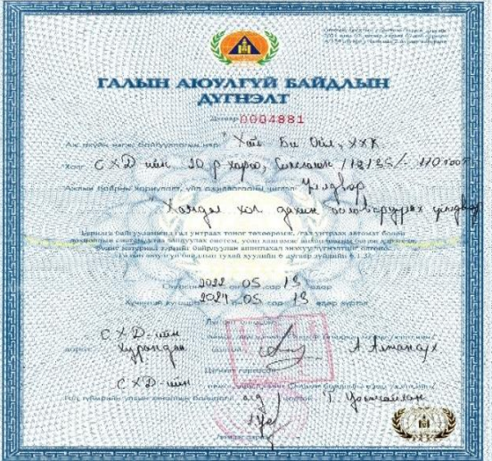
Зураг 2. Галын дүгнэлт

2. Техникийн хаягдал тос дахин боловсруулах үйлдвэрийн галын аюулгүй байдлын дүгнэлтийн хугацаа дууссан тул үйдвэрийн галын аюулгүй байдлыг хангах үүднээс шаардлагатай зүйлүүдийг нэмж хийн дүгнэлтийн хугацааг 2 жилээр сунгалт хийлгэв.