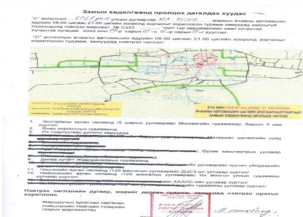
Зураг 7. Авто машины түр зөвшөөрөл

8. Ажилчидын унаа машин (Stagex) болон бусад тээврийн хэрэгсэл автомашинуудад ээлжит урсгал засвар үйлчилгээнүүдийг хийж, тээврийн хэрэгслийн даатгал, татвар, улсын үзлэг, оношилгоонд бүрэн хамруулсан.