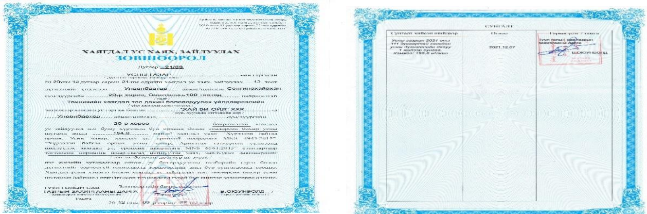
Зураг 3. Хаягдал ус хаях зайлуулах зөвшөөрөл

4. Байгаль Орчины Яамны харьяа хэмжилзүйн төв лабораторт жил бүр цэвэр усны шинжилгээ өгсөн.