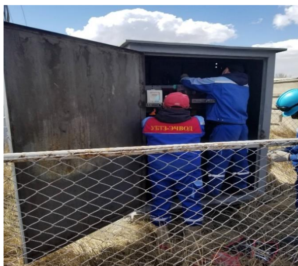
Зураг 6. Трансформаторын засвар үйлчилгээ

7. Нийслэл хот дотроо үйл ажиллагаа явуулдаг авто засварын газруудаас “Техникийн ашигласан хаягдал тос” тээвэрлэдэг зориулалтын автомашинд хот дотор явах ЕС зөвшөөрлийн сунгалтыг хийлгэж хагас жилээр түр зөвшөөрлөө авсан.