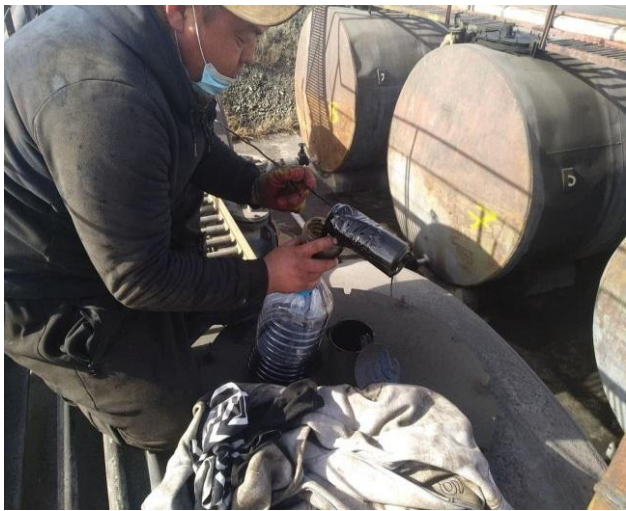
Зураг 1. Амбер шинжилгээ

2. Техникийн хаягдал тос дахин боловсруулах үйлдвэрийн галын аюулгүй байдлын дүгнэлтийн хугацаа дууссан тул үйдвэрийн галын аюулгүй байдлыг хангах үүднээс шаардлагатай зүйлүүдийг нэмж хийн дүгнэлтийн хугацааг 2 жилээр сунгалт хийлгэв.