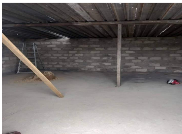
Зураг 9. Блокон барилгыг шилжүүлэн барьж буй ажлын явц