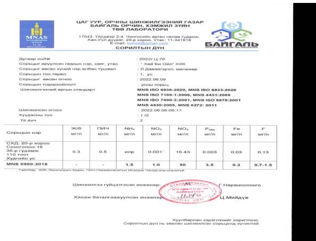
Зураг 4. Цэвэр усны шинжилгээ

4. Байгаль Орчины Яамны харьяа хэмжилзүйн төв лабораторт жил бүр цэвэр усны шинжилгээ өгсөн.